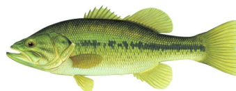
Lobina de boca grande

*Ilustraciones de peces de Virgil Beck