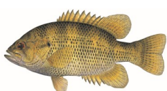
Perca de roca